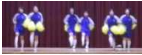
3年生…恋する乙女を応援します

各校で行われた「文化祭」で披露したダンスを紹介しました。両校共きれいなダンスを披露してくれました。