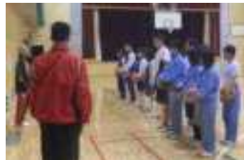
2年生…体育(上中生7名)