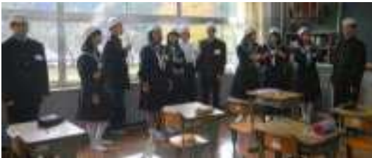
1年生…数学(上中生2名)