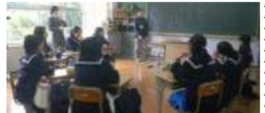
3年生…国語(上中生1名)